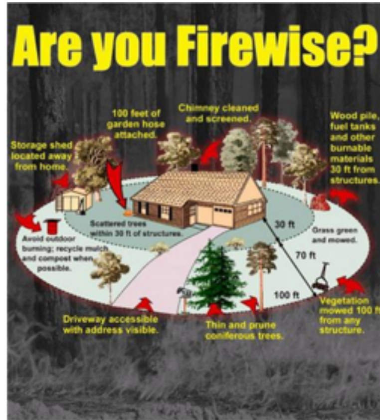
Vegetatie. Flyer in ontwikkeling